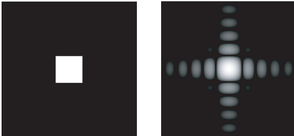
Abbildung 1: Rechteckblende (links) und erzeugtes Beugungsbild (rechts).